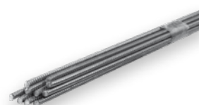
Skalflex Armérstål á 80 cm, Ø 6 mm 10 stk, DB-nr.: 5124341

Industrivej 20B · 8800 Viborg · Tlf. 86 61 22 99 · kundeservice@dk.sika.com · www.skalflex.dk