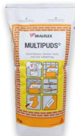
Skalflex Multipuds® 20 kg, DR-nr. 5344208